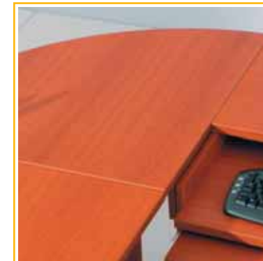
jednoduchý spojovací systém > umožňuje spojovat stoly do sestav