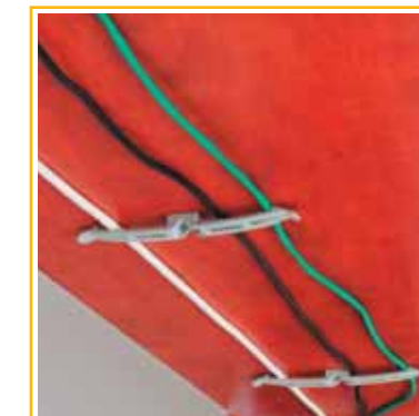
vedení kabeláže > slouží k uchycení velkého množství kabelů