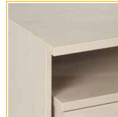
3 mm hrana ABS > chrání pracovní desky a nohy před poškozením