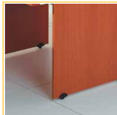
rektifikace > slouží k dorovnání nerovností podlah